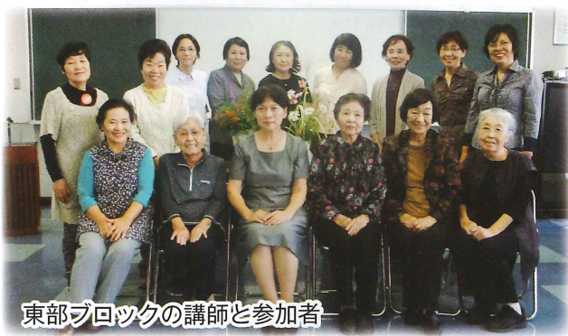
東部ブロッックの講師と参加者

挿し木で育つハーブを分けていただき、その後、参加者の皆さんの庭や鉢で、ハーブは元気に育っていることと幸いです。 ハーブでQOL高まっていますか？