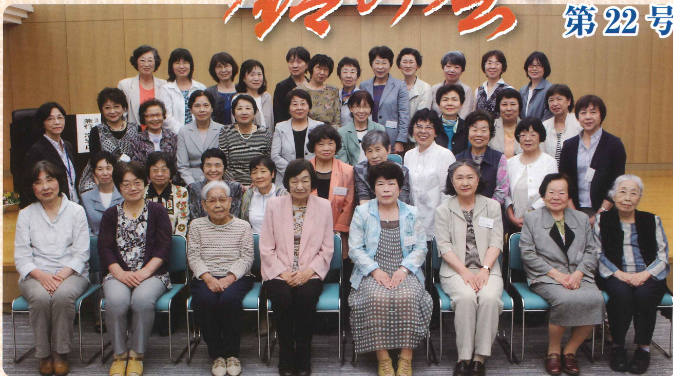
平成28年度総会・第1回研修会（5月24日）