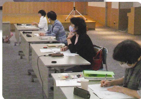
令和二年度第1回役員会